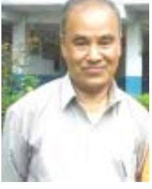
- पूर्ण ताम्राकार -